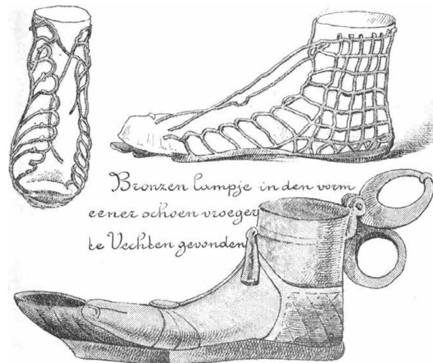
Bronzen lampje in den vorm eener schoen vroeger te Vechten gevonden.