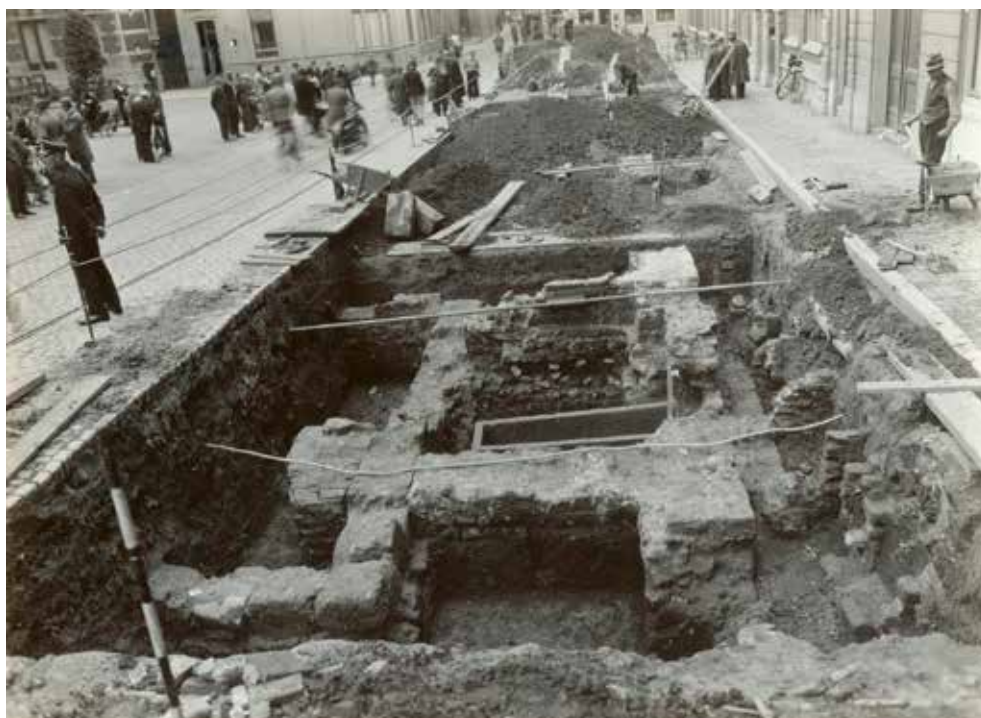
3 Gezicht op de opgravingen op het Domplein in 1933. COLLECTIE FOTOGRAFISCHE DOCUMENTEN HET UTRECHTS ARCHIEF, CAT.NR. 42590.

Toen de Bataafse mythe uit het culturele geheugen verdween, ontstond er ruimte voor een herinterpretatie van de Romeinse Tijd. Gelijkijdig met deze verandering, maar niet als gevolg van, ontstond er een roep onder archeologen in Utrecht om systematisch archeologisch onderzoek. Hierbij nam men stilaan afscheid van een historiografie louter gebaseerd op geschreven bronnen en gingen Utrechtse archeologen materiële objecten als primair bronnenmateriaal gebruiken om eerdere verhalen uit het verleden op waarheid te toetsen. Dit betekende dat het militaire narratief van de Bataafse mythe plaatsmaakte voor een geschiedenis van sociale, culturele en economische interactie op basis van de gevonden scherven, munten en goederen. De prijsvraag die het PUG uitschreef in 1842 is wellicht het mooiste voorbeeld van deze transformatie. De inzendingen beroepen zich op recente vondsten en maken maar mondjesmaat gebruik van de teksten van Caesar en Tacitus, en spreken uitgebreid over handelscontacten tussen de Friezen en Romeinen op Utrechtse bodem. De historische conceptualisatie van de Romeinen in Utrecht was wat wij vandaag de dag een